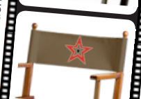
Disney CRUISE LINE