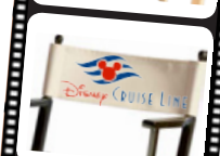
Disney CRUISE LINE